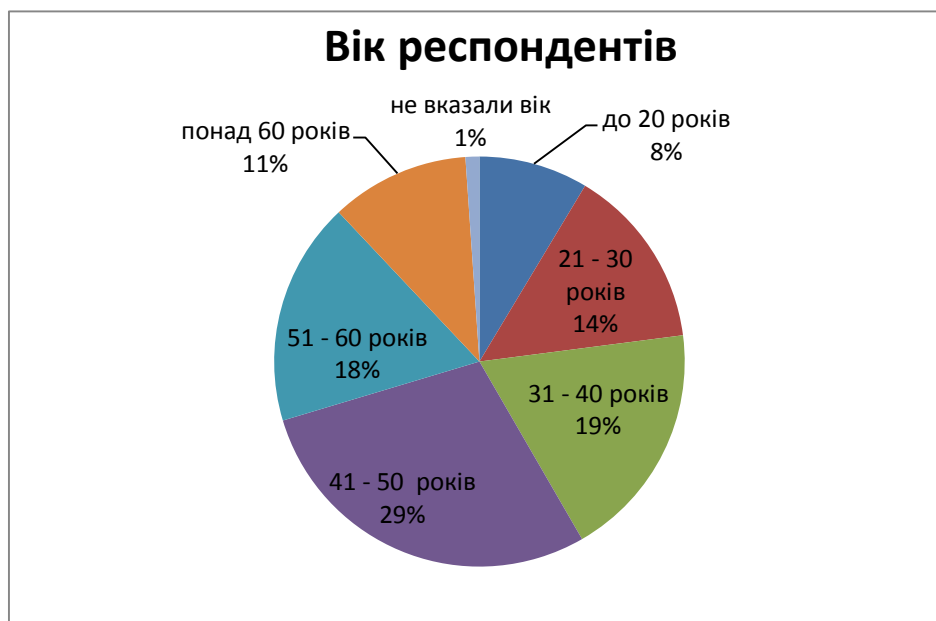
Мал. № 1. Діаграма: «Розподіл респондентів за віком».